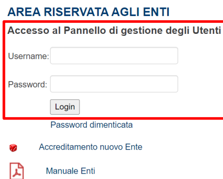
Figura 3.1: Area riservata agli Enti (Login)

Una volta accreditato l'Ente gestisce le proprie Utenze individuali utilizzando la macro-utenza creata in fase di accreditamento. Inserendo le credenziali della macro-utenza (tipo: DADO@ACRONIMO) nell'Area Riservata agli Enti (Figura 3.1) è possibile accedere al pannello di gestione delle utenze individuali (Figura 3.2), ove compariranno tutte le richieste degli utenti che richiederanno l'accesso alla Piattaforma per conto dell'Ente.